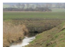
Bachverrohrung DN 1.200